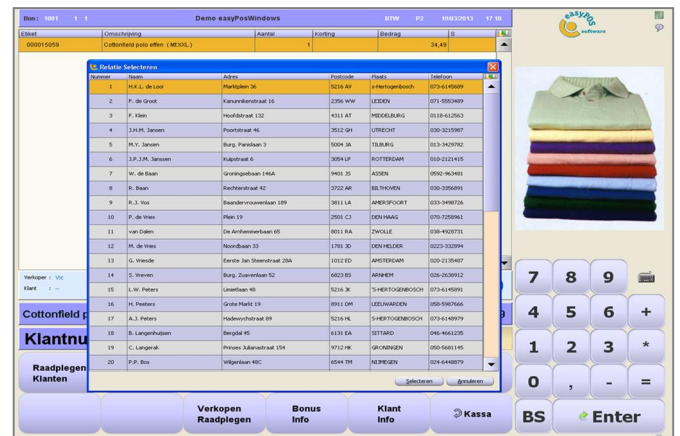
Koppeling klantenbeheer: vasthouden aankopen & bonussysteem